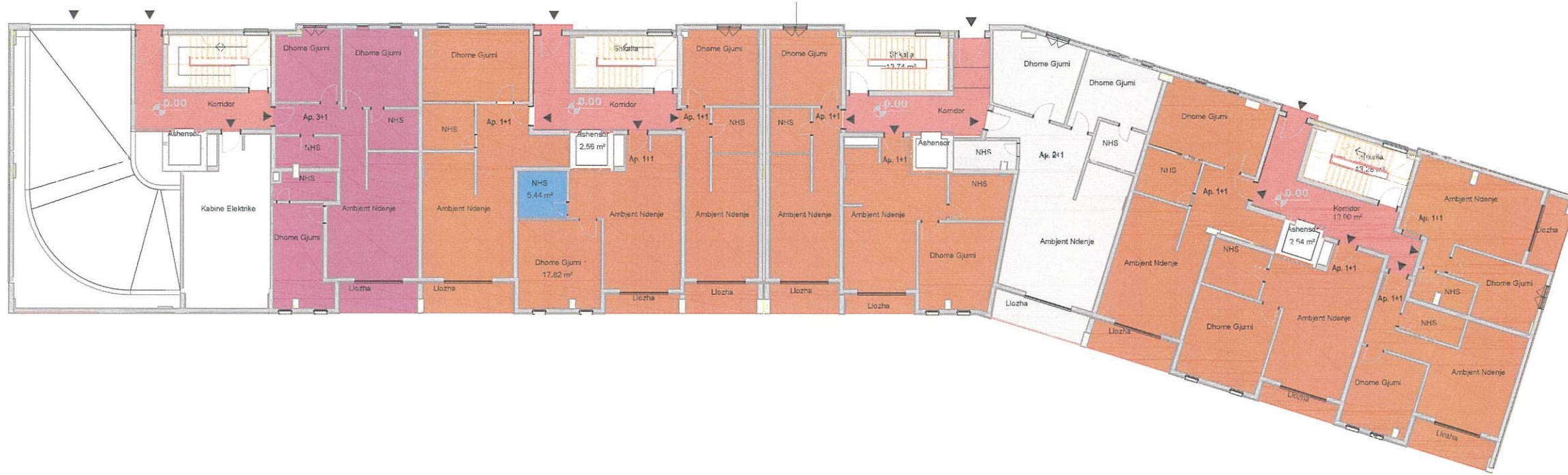
Planimetri Objekti 2.1 Kati Perdhe Banim