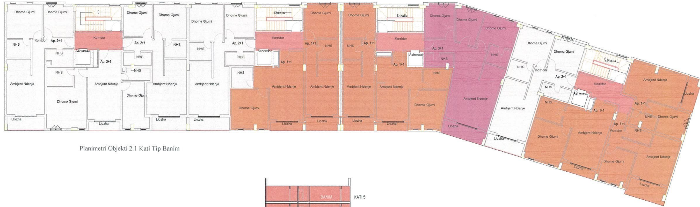
Planimetri Objekti 2.1 Kati Tip Banim